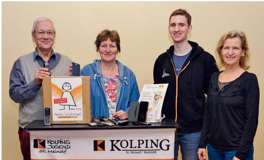
Oben: Die Kolpingsfamilie Bielefeld St. Meinolf und die Kolpingjugend werben für die Aktion. Insgesamt sind über das Bielefelder Stadtgebiet verteilt 14 Annahmestellen eingerichtet, unter anderem in zehn Kindertagesstätten. Die vom Bundessekretariat vorbereitete Presseinformation wurde von den Bielefelder Tageszeitungen sowie den kostenfreien Stadtteilzeitungen abgedruckt.