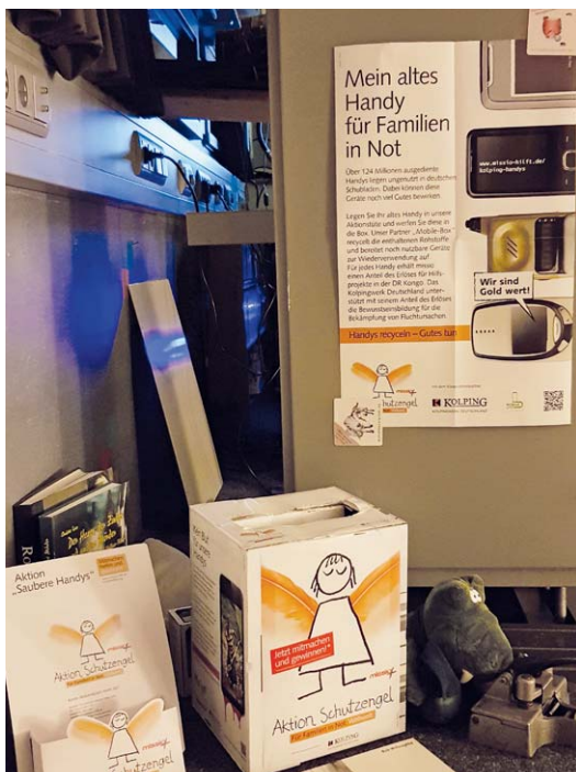
Eine ihrer acht Annahmestellen hat die Kolpingsfamilie Kirchlengern in einem Kino eingerichtet. Dort lief der Dokumentarfilm „Welcome to Sodom - Dein Smartphone ist schon hier“, der eindrücklich die Situation auf einer illegalen Elektroschrott-Deponie, einem verseuchten Ort in Ghana zeigt. Dort landen auch Abfälle und Schadstoffe aus den Industrieländern.