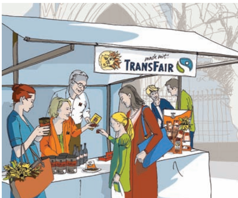
Am Tatico-Kaffeestand können Kolpingmitglieder mit Passanten ins Gespräch kommen.

Sicherlich wird sich das aufgeworfene Problem nicht mit einer einzigen Gesprächsrunde lösen lassen. Aber die Kolpingsfamilie und die interessierte Öffentlichkeit können aufmerksam werden, und sie können motiviert werden, an Lösungen mitzuwirken. Wichtige beteiligte Personen und Institutionen kommen zusammen und lernen sich (besser) kennen. Ein wichtiger erster Schritt kann also erfolgen. Der ernsthafte Wille, weitere notwendige Schritte folgen zu lassen, muss natürlich vorhanden sein.