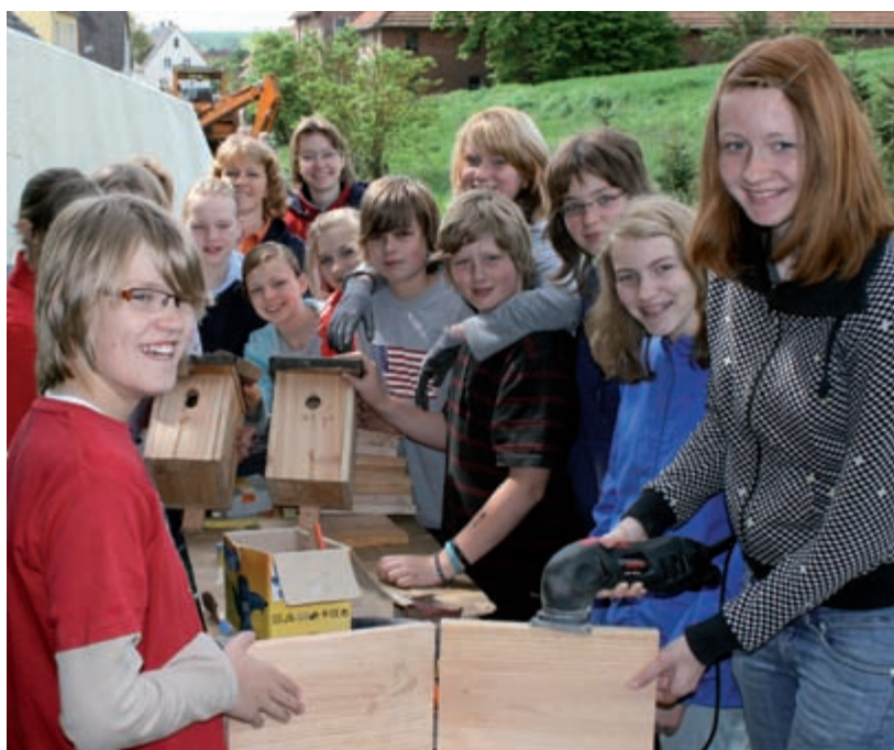
Bei regionalen 72-Stunden-Aktionen des BDKJ ist Kolping immer dabei. Das Bild zeigt die Kolpingjugend aus Natungen beim Bau von Nistkästen.