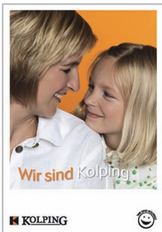
Im Kampagnen-Themenflyer werden die Handlungsfelder ausführlich beschrieben.

Der Vorstand bzw. der Vorbereitungskreis muss nun überlegen, für welches der vier Handlungsfelder ein besonderer Bedarf oder eine vorrangige Perspektive besteht. Vielleicht gibt es bereits Aktivitäten, die damit zusammenhängen, oder engagierte Mitglieder zeigen eine Vorliebe für eines der im Leitbild beschriebenen Handlungsfelder.