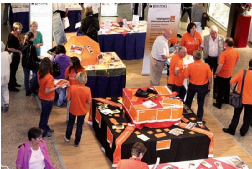
Alles orange: Mit den Artikeln der Imagekampagne können sich Kolpingsfamilien gut in der Öffentlichkeit präsentieren.

Manche Gottesdienstbesuchende haben es eilig, nach der Heiligen Messe nach Hause zu kommen, oder sie stehen aus anderen Gründen unter Zeitdruck. Andere Teilnehmende des Gottesdienstes lassen sich aber durchaus zur Begegnung und Information einladen. Dazu können bei schönem Wetter