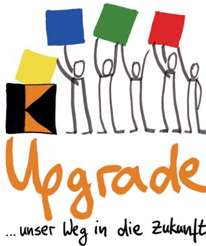
Aktionszeichen des Zukunftsprozesses.

Die Mitgliederumfrage soll die Einschätzungen der Mitglieder am Ausgangspunkt dieses Prozesses deutlich machen. Damit wird eine Grundlage für die weiteren Beratungen geschaffen, aber noch kein Ergebnis vorweggenommen.