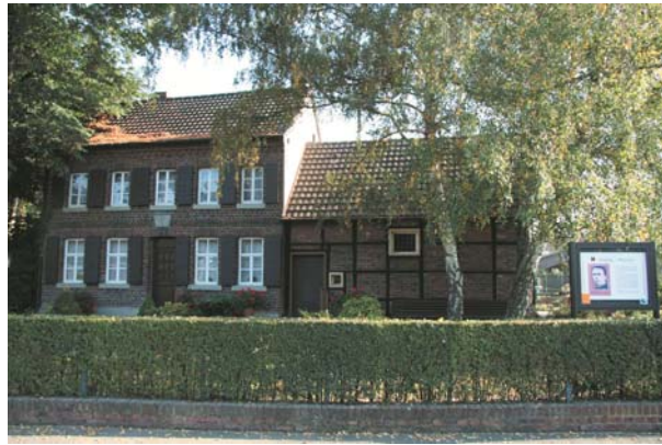
Geburtshaus in Kerpen

Kolping erlebte den Zusammenbruch der Zünfte. Mit Einführung der Gewerbefreiheit in Preußen 1810 änderte sich das Verhältnis zwischen Meister und Gesellen. Die Meister empfanden sich nicht mehr als Schutzherrn, sondern betrachteten die Gesellen zunehmend als bloße Arbeitskräfte. Damit verloren die Gesellen auch ihr Zuhause in der Familie des Meisters. Diente früher die Wanderschaft der fachlichen Qualifikation der Gesellen, so mussten sie nun jahrelang von einem Ort zum anderen umherziehen, um in der Ferne eine Anstellung zu finden. Kolping, getrieben von dem Wunsch nach handwerklicher Perfektion, ging auch auf Wanderschaft. Sein Weg führte ihn nach Sindorf, Düren, Lechenich und Köln. Hierbei lernte er das Elend der wandernden Gesellen am eigenen Leibe kennen: Kein Heim, keine Familie, keine Perspektive.